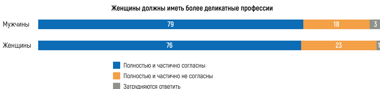
Рисунок 1. Поддержка гендерных норм на работе, %

Большинство женщин и мужчин в равной степени поддерживают идею о том, что женщины должны заниматься более деликатными видами деятельности, например, работать медсестрами, учителями, секретарями (76 и 79 процентов соответственно, см. Рисунок 1). Одним из объяснений этой поддержки может быть то, что норма, согласно которой женщины должны выполнять более «деликатную» работу, не обязательно ставит женщин ниже мужчин и не подразумевает, что женщины менее способны или умны. «Деликатная» профессия может восприниматься как более подходящая для женщин, поскольку под этим может подразумеваться работа с людьми (например, уход за больными), а не работа с неодушевленными предметами (например, машинами). Это наблюдение подтверждается определенным набором профессий и навыков, с которыми женщины себя ассоциируют 1 . Также считается, что женщины нуждаются в «защите» от работы с тяжелой физической нагрузкой или профессий, связанных с риском для жизни.