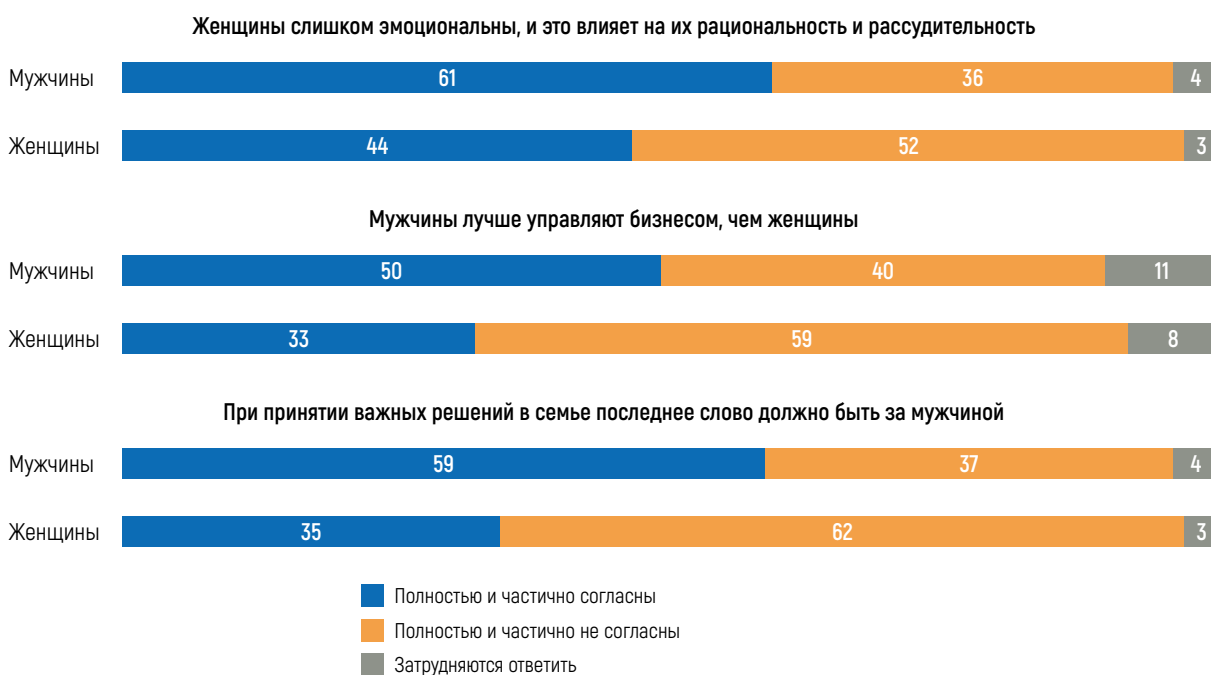
Рисунок 3. Поддержка стереотипов, % 2